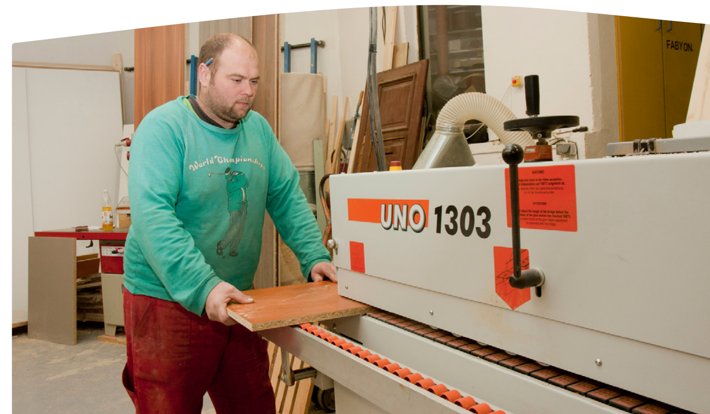
Olepovačka hran v akci.