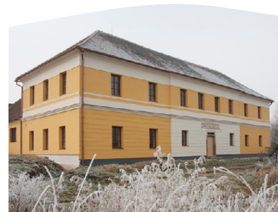
Dům sociálních služeb v Chrášťanech.