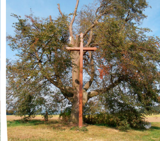
Dřevěný kříž na Červeném vrchu (TNV).