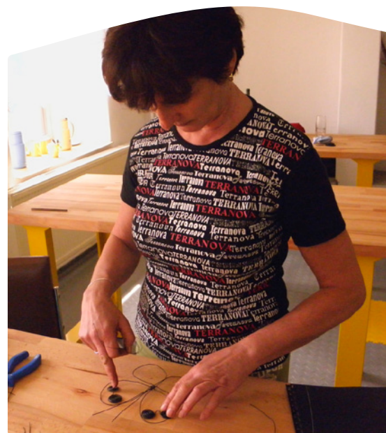
Řemeslný kurz Drátování.

Více informací k jednotlivým kurzům naleznete na www.lidovaremesla.cz . Projekt „Lidová řemesla v mikroregionu Lužnice a Vltavotýnsko“ vznikl díky úzké spolupráci MAS Lužnice a MAS Vltava a za finanční pomoci z Programu rozvoje venkova.