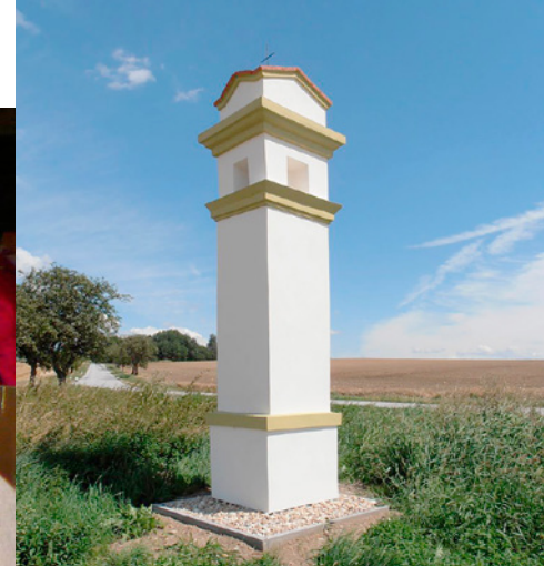
Boží muka u Jarošovic.

cích se zemědělstvím a lesnictvím a podporou účinného využívání zdrojů v odvětvích zemědělství, potravinářství a lesnictví. Dále umožní vytvořit podmínky pro růst konkurenceschopnosti zemědělských a potravinářských podniků, napomůže lepší organizaci potravinového řetězce, včetně zpracovávání zemědělských produktů a jejich uvádění na trh. Program bude také podporovat diverzifikaci ekonomických aktivit ve venkovském prostoru s cílem vytvářet nová pracovní místa a zvýšit hospodářský rozvoj. Podporován bude komunitně vedený místní rozvoj, resp. metoda LEADER, která přispívá k lepšímu zacílení podpory na místní potřeby daného venkovského území a rozvoji spolupráce aktérů na místní úrovni. Horizontální prioritou je předávání znalostí a inovací formou vzdělávacích aktivit poradenstvím a spolupráce v oblasti zemědělství a lesnictví.