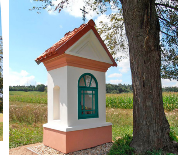
Kaple sv. Josefa u Čihovic.