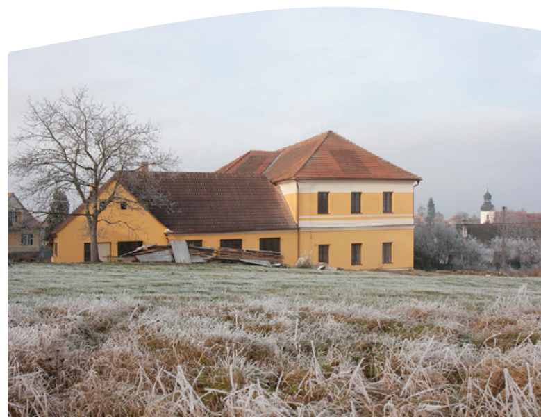
Pohled z širší perspektivy.

V blízké budoucnosti počítá sdružení s provozem místního mateřského centra a senior klub v nově rekonstruovaných prostorech bývalých tříd, v případě zájmu i s nízkoprahovým zařízením pro mládež. Držíme palce!